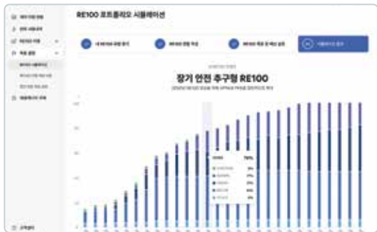
RE100 포트폴리오 시뮬레이션