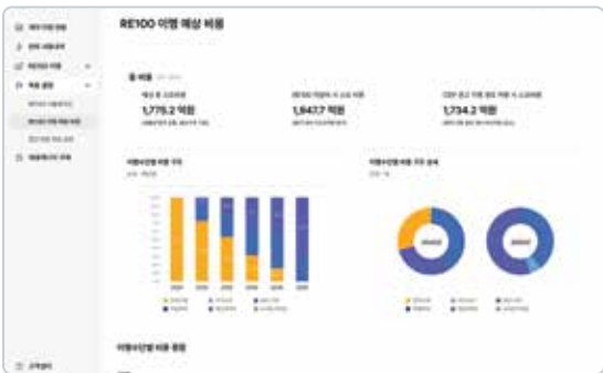
RE100 이행 예상 비용 계산